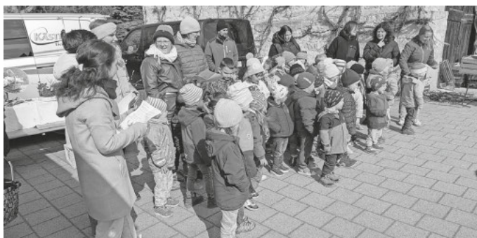
Singen auf dem Wochenmarkt

Am Nachmittag fand im Kindergarten ein Eltern-Kind-Bastelnachmittag rund um das Thema „Ostern“ statt. Dabei hatten Eltern und Kinder die Gelegenheit, gemeinsam einen Osterkranz zu gestalten. In gemütlicher Atmosphäre, begleitet von Getränken und kleinen Snacks, klang der Nachmittag entspannt aus.