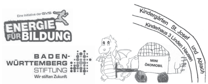
Mini-Ökomobil" ist ein Projekt im Rahmen des Programms "Nachhaltigkeit lernen - Kinder gestalten Zukunft" der Baden-Württemberg Stiftung.