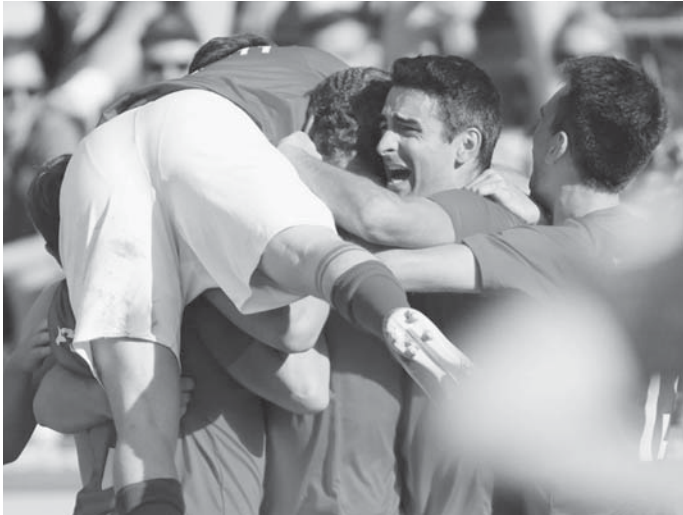
Freude und Erleichterung pur nach den späten Siegtreffern vergangenen Sonntag gegen den FV Schelklingen-Hausen.