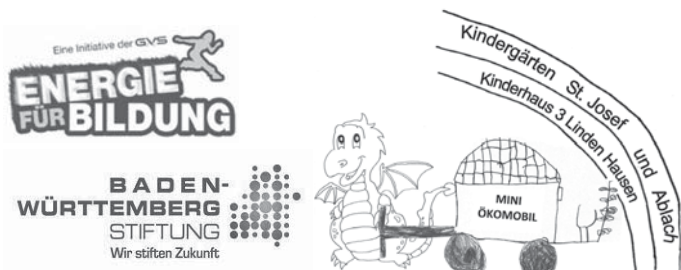
Mini-Ökomobil ist ein Projekt im Rahmen des Programms "Nachhaltigkeit lernen - Kinder gestalten Zukunft" der Baden-Württemberg Stiftung.

Das Thema Weltall wird die Kinder weiterhin begleiten, denn auch der „Tag der kleinen Forscher“ im Juni widmet sich diesem Thema: „Abenteuer Weltall - komm mit!“ Diese bundesweite Mitmachaktion ist für alle, die gerne forschen. Er stellt die Bedeutung des forschenden Lernens in Kita, Hort und Grundschule in den Mittelpunkt und widmet sich jedes Jahr einem neuen, spannenden Thema rund um Mathematik, Informatik, Naturwissenschaften, Technik und Nachhaltigkeit. Dabei zeigt der Aktionstag immer wieder: Gute frühe MINT-Bildung für nachhaltige Entwicklung macht Kinder stark und befähigt sie, selbstbestimmt und verantwortungsvoll zu handeln.