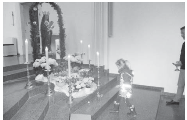
Kindergarten Don Bosco