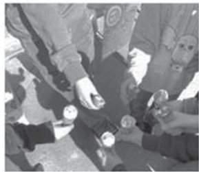
...dieses Eis hatten sich unsere Minis wahrlich verdient!!!