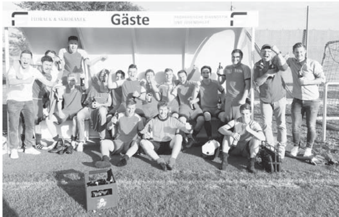
Freude pur in Altheim nach dem ersten Auswärtssieg der Saison!

Eine satter Heimspielsamstag an dem es um wichtige Punkte geht. Gelingt ein neuerliches 6-Punkte-Wochenende und der Druck könnte endlich wieder etwas entweichen aus dem dampfenden Kessel. Die Jungs freuen sich auf zahlreiche und lautstarke Unterstützung!