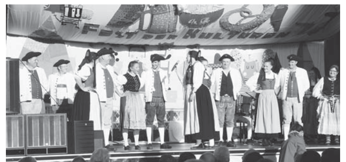
Auftritt beim Fest der Kulturen in Sigmaringen am vergangenen Sonntag