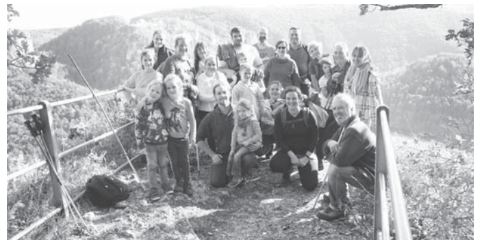
Wochenendaufenthalt der Volkstanzgruppe im Donautal