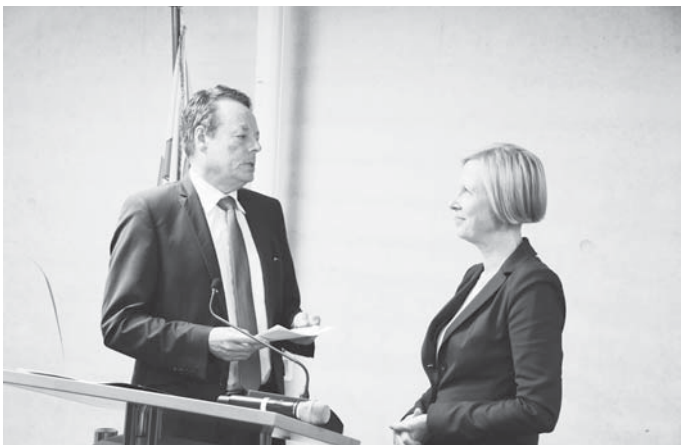
Regierungspräsident Klaus Tappeser nimmt die Wiederverpflichtung von Landrätin Stefanie Bürkle vor.

Der Amtseinführung schloss sich der Sommerempfang des Landkreises an. Unter den Gästen waren auch die „Coronahelden“ des Landkreises, die seit Beginn der Pandemie Wertvolles für den Landkreis und unsere Gesellschaft leisten.