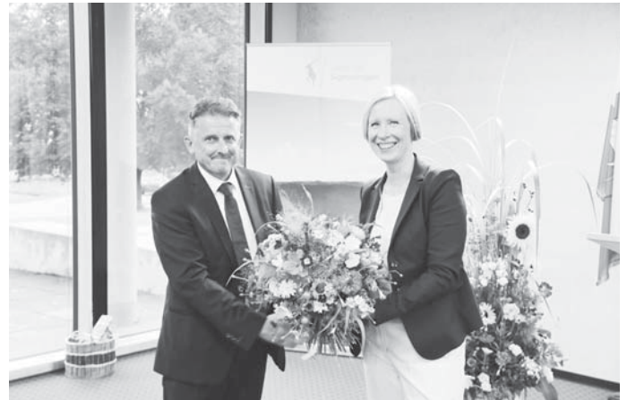
Bürgermeister Jochen Spieß beglückwünscht Landrätin Stefanie Bürkle.