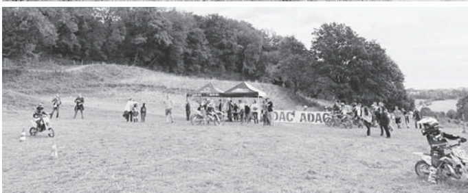
Euer Jugend-Team des RRT-Scheer