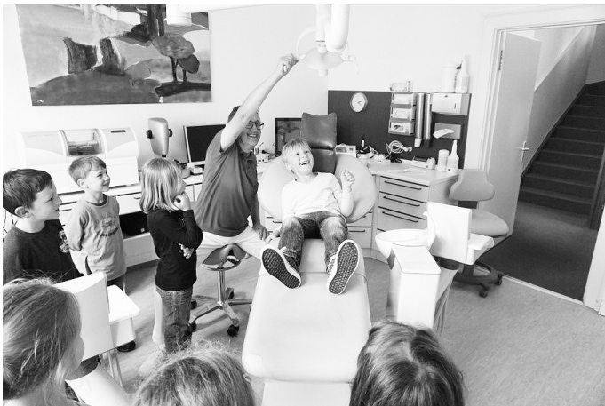
Die Kinder und Erzieherinnen vom Kindergarten Ablach

Mit großer Begeisterung konnten die Kinder einige Instrumente selbst ausprobieren, wie beispielsweise den Bohrer und den Sauger und lernten dabei, wie man einen Zahn wieder „heil macht“. Sie trauten ihren Augen kaum, als auch noch ein zweites Zauberlicht gezeigt wurde, welches die weiche Füllmasse steinhart bzw. „zahnhart“ machte. Wir sagen herzlichen Dank für diesen tollen und erlebnisreichen Nachmittag und freuen uns schon auf nächstes Jahr.