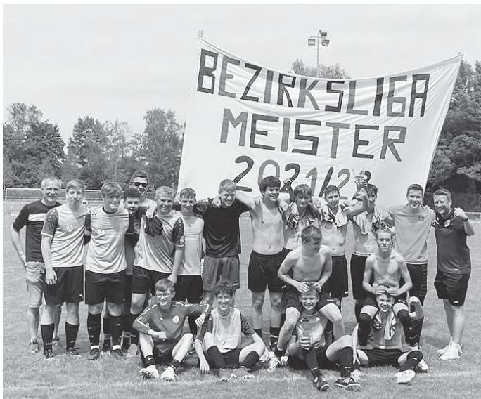
Glückwunsch an unsere B-Junioren!