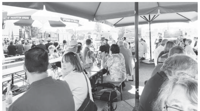
Die Schattenplätze waren schnell belegt.