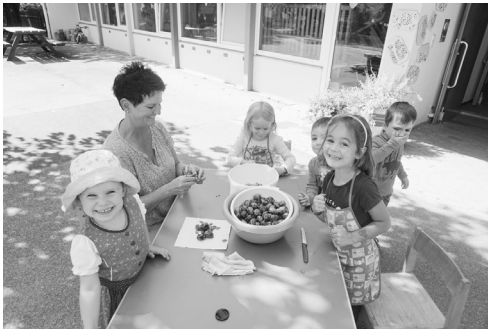
Die Kinder und das Team vom Kindergarten Ablach